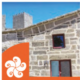
PORTA DE MONTALEGRE