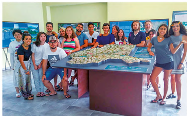
Visita do Grupo Internacional de traballo de Muíños en 2018.

Este material educativo transfronteirizo verase reforzado por una exposición itinerante sobre a RBTGX, que se poderá visitar a finais do ano 2019 no Centro Cultural Marcos Valcárcel da Deputación de Ourense.