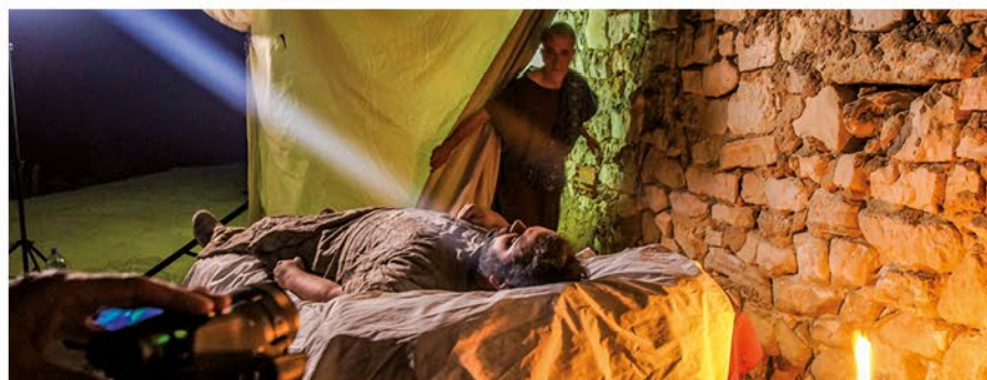
Documentación con actores e recreación en 3D do Aquis Querquennis.