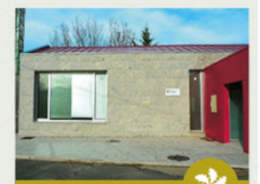
PORTA DE LOBEIRA CENTRO DE INT. DA ETNOGRAFÍA

Infraestrutura situada na rehabilitada biblioteca municipal, cuxa principal finalidade é a de divulgar, informar e promover a RBTGX e o Parque Natural Baixa Limia-Serra do Xurés, así como dar a coñecer a súa riqueza botánica, a través dun centro de interpretación dedicado á flora do parque.