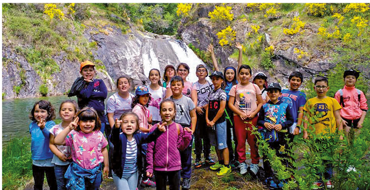
Visitas escolares no parque durante os meses de maio e xuño.

As visitas de escolares dos diferentes colexios da provincia, apoiáronse co reparto de material didáctico.