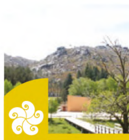
PORTA DE LAMAS DE MOURO