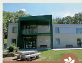
PORTA DE MUÍÑOS C. DE INT. DA AUGA E AULA ARQUEOLÓXICA

Infraestrutura situada nunha vivenda tradicional rehabilitada, cuxa principal finalidade é a de divulgar, informar e promover a RBTGX e o Parque Natural Baixa Limia - Serra do Xurés, así como dar a coñecer a súa paisaxe, a través dun centro de interpretación dedicado á súa xeomorfoloxía.