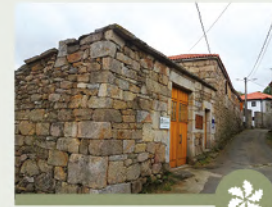
PORTA DE CALVOS DE RANDÍN CENTRO DE INT. "COUTO MIXTO"

Infraestrutura situada preto do xacemento romano de Aquis Querquennis, cuxa finalidade é a de divulgar, informar e promover a Reserva da Biosfera Transfronteriza Gerês-Xurés (RBTGX) e o Parque Natural Baixa Limia - Serra do Xurés, así como dar a coñecer o pasado histórico da zona.