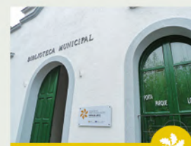
PORTA DE LOBIOS CENTRO DE INT. DA FLORA

Infraestrutura de nova construción cuxa principal finalidade é a de divulgar, informar e promover a RBTGX e o Parque Natural Baixa Limia-Serra do Xurés, así como dar a coñecer o Centro de Int. do Auga. Tamén acolle a Aula Arqueolóxica do Megalitismo do Val do Salas e da Serra do Leboeiro, aberta no ano 2019 grazas ao proxecto.