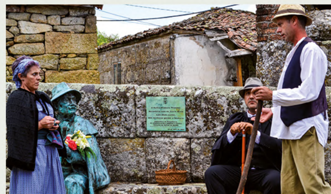
Representación teatral no Couto Mixto 2019.

Por todo isto coincidindo co día de elección dos xuíces honorarios do Couto Mixto, Xeitura: Xestión do Patrimonio Cultural no 2018 e Platea Lúa no 2019, deron a coñecer dun xeito ameno e didáctico a historia do Couto Mixto a través dunha pequena representación teatral ambientada na segunda metade do século XIX, onde catro personaxes axudarannos a coñecer as singularidades dun enclave único no territorio galego, español e portugués, así como Europeo. A representación realizouse no adro da igrexa de Santiago de Rubiás, lugar emblemático do Couto mixto.