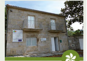
PORTA DE ENTRIMO CENTRO DE INT. DA XEOMORFOLOXÍA E DA PAISAXE

Infraestrutura situada na rehabilitada reitoral de Santiago de Rubiás, cuxa principal finalidade é a de divulgar, informar e promover a RBTGX e o Parque Natural Baixa Limia - Serra do Xurés, así como dar a coñecer a historia dun enclave único, o Couto Mixto, a través do seu centro de interpretación.