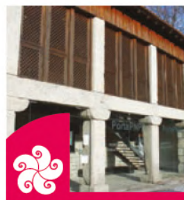
PORTA DE CAMPO DO GERÊS