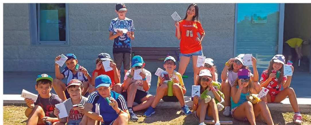
Taller de sensibilización do mes de agosto de 2018 en Muíños.