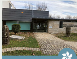
PORTA DE BANDE CENTRO DE INTER- PRETACIÓN "AQUIS QUERQUENNIS"

Infraestrutura situada preto do xacemento romano de Aquis Querquennis, cuxa finalidade é a de divulgar, informar e promover a Reserva da Biosfera Transfronteriza Gerês-Xurés (RBTGX) e o Parque Natural Baixa Limia - Serra do Xurés, así como dar a coñecer o pasado histórico da zona.